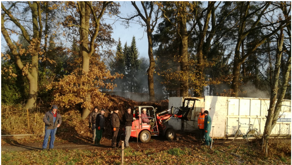
Marcardsmoorer und Upschörter in guter Gemeinschaft im Friedhofeinsatz.